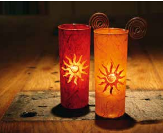
Die Windlichter von Feuer und Glas werden in Deutschland mit Papier beklebt