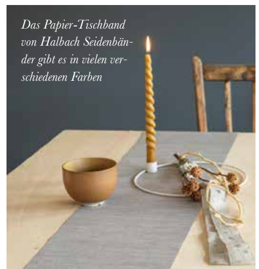
Das Papier-Tischband von Halbach Seidenbänder gibt es in vielen verschiedenen Farben