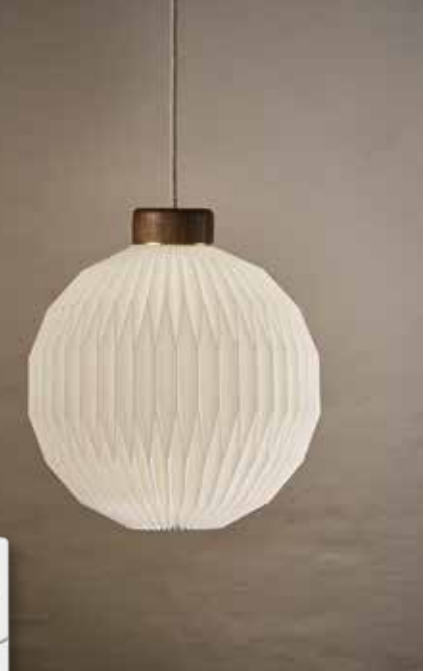
Gefaltete Lampenschirme aus Papier gibt es bei Le Klint seit 1943