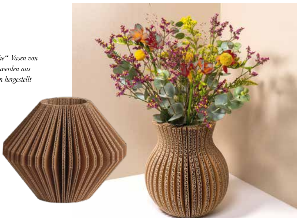
Die „Cache-cache“ Vasen von tout simplement werden aus recyceltem Karton hergestellt

höher als breit und mal umgekehrt. Um einen frischen Blumenstrauß in diese Vase stellen zu können, muss nur noch eine Plastikflasche auf die entsprechende Höhe geschnitten und hinein gestellt werden, so dass dieser auf diesem Weg neues Leben eingehaucht wird. Philippe Ferreux, der Designer und Gründer von „tout simplement“, möchte Objekte kreieren, die man dank des funktionellen und schlichten Designs sein Leben lang behält. In der Sommerkollektion 2024 der Firma Goldbach Geschenkartikel gibt es eine Vase aus Papierseil und Bast. Mit einem Durchmesser von 24 und einer Höhe von 32 Zentimetern in warmen Beige- und Orange-Tönen verleiht diese jedem Raum eine gemütliche Note.