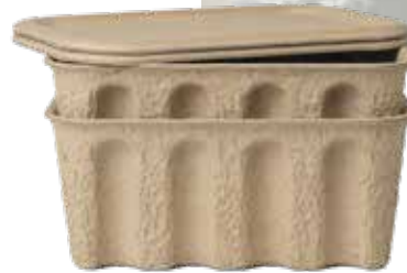
„Paper Pulp Box“ und „Paper Pulp Paper Bin“ sind bei Ferm Living erhältlich