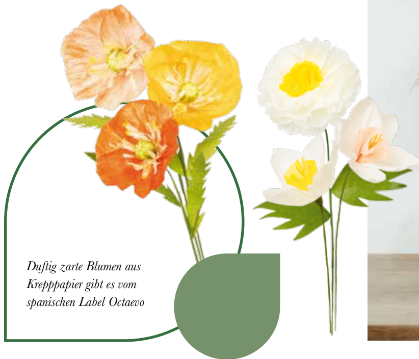
Duftig zarte Blumen aus Krepppapier gibt es vom spanischen Label Octaevo