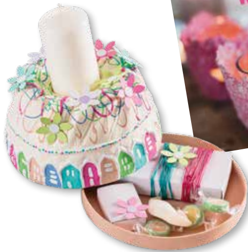
Objekte aus Pappmaché sind die Basis der Papp-Art-Technik bei Efcó