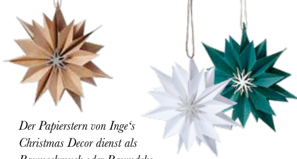
Der Papierstern von Inge's Christmas Decor dient als Baumschmuck oder Raumdeko