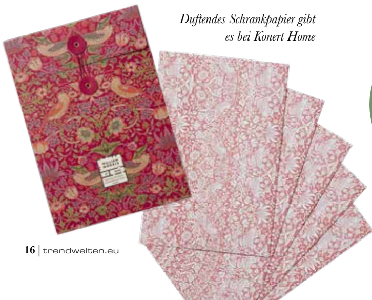
Duftendes Schrankpapier gibt es bei Konert Home

Das praktische „1 für 4-Papier“ von Compostella ist kompostierbar