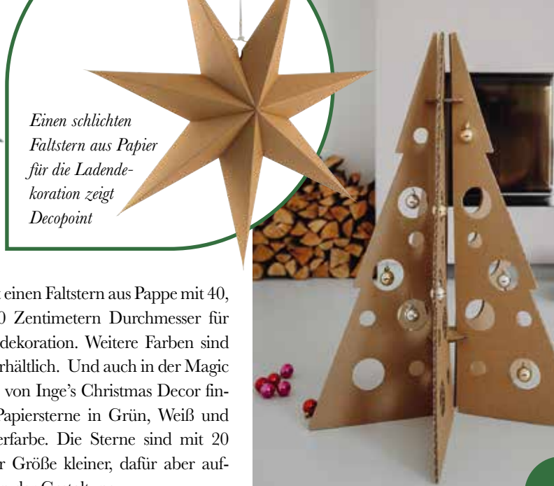
Einen schlichten Faltstern aus Pappe für die Ladendekoration zeigt Decopoint