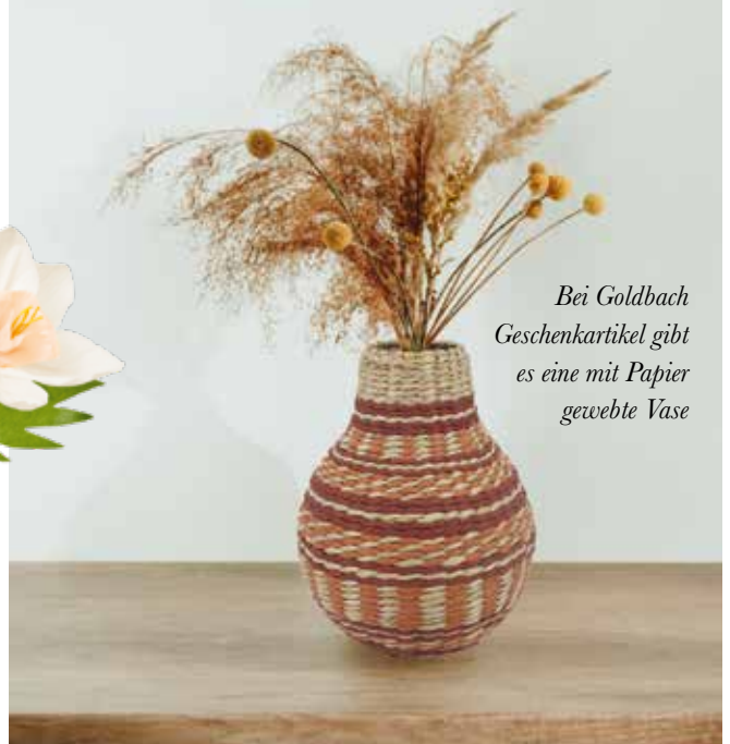
Bei Goldbach Geschenkartikel gibt es eine mit Papier gewebte Vase

Strauß, denn er verwelkt nie und die Blumen sind aus FSC-zertifiziertem Papier. Beim Label Octaevo aus Barcelona sind die Blumen dagegen duftig zart, denn der Papierblumenstrauß besteht aus Krepppapier. Die Blätter können dank des Drahtes nach Belieben geformt werden. Es gibt zwei Farbvarianten, die inspiriert sind vom mediterranen Sonnenaufgang und Sonnenuntergang. Der Blumenstrauß besteht aus drei Blumen, die 50 Zentimeter hoch sind, und wird in Europa hergestellt.